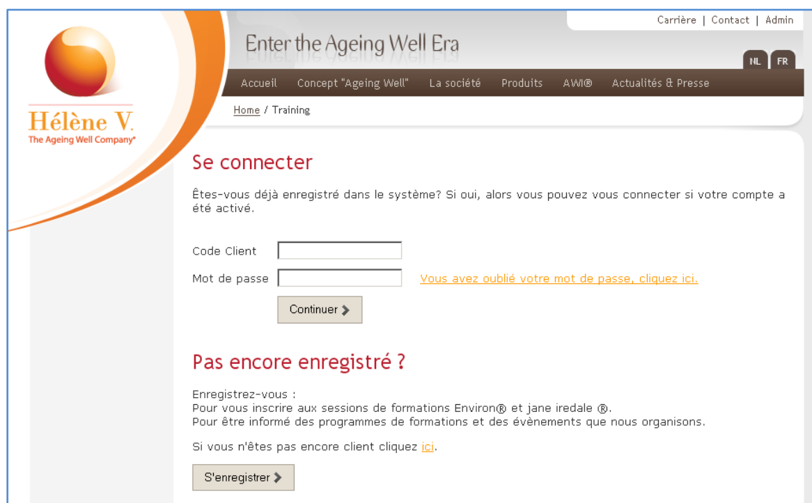
Figure 1: Enregistrement et accès au compte utilisateur

Ensuite cliquez sur le lien " Formations " qui se trouve dans le menu principal. Vous arriverez sur cette page :